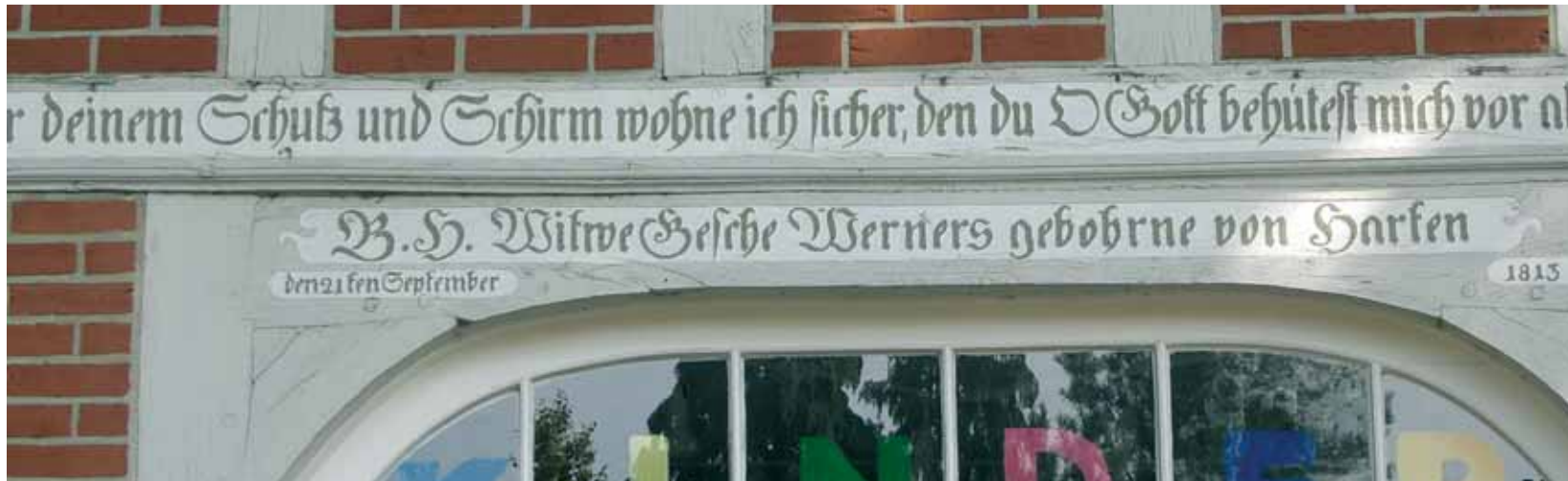
Spruch im Original der alten Eingangstür unseres Kindergartens